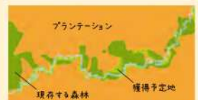
プランテーション