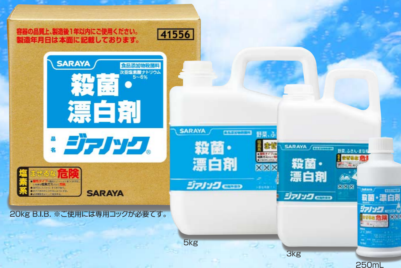
20kg B.I.B. ※ご使用には専用コックが必要です。

リネン類の殺菌・漂白に、施設内の便・嘔吐物の処理に…様々なシーンでご使用いただけます。