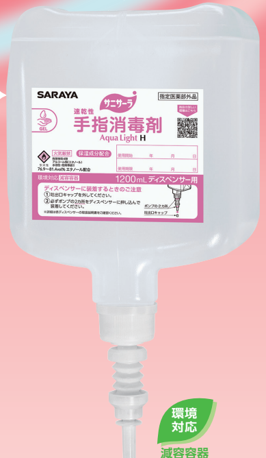
1200mLディスペンサー用