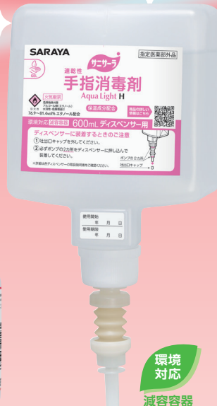
600mLディスペンサー用