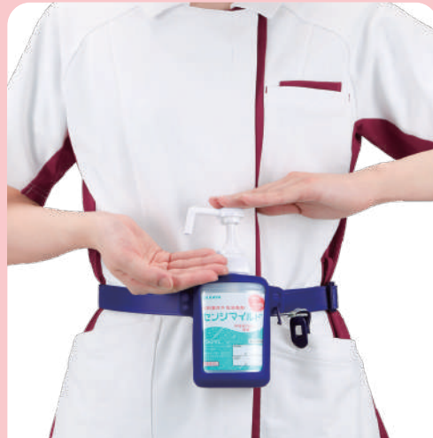
腰巻きタイプとして