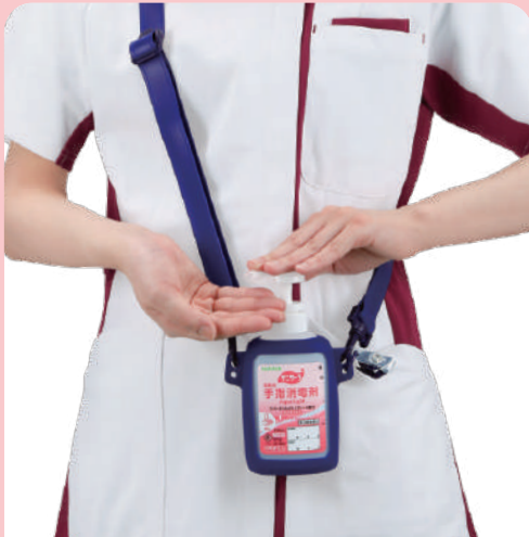
肩掛けタイプとして