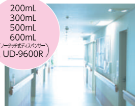
病室前の手摺や壁付けに

様々な規格やオプション品をご用意しています。詳細は、担当営業までお問い合わせください。