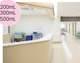
診療室やナースステーションに